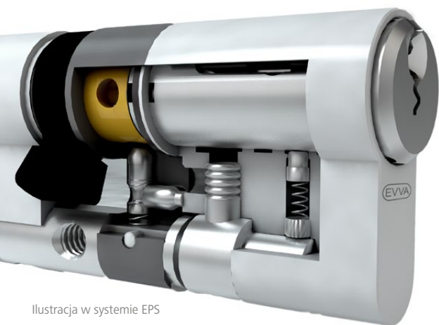
Ilustracja w systemie EPS